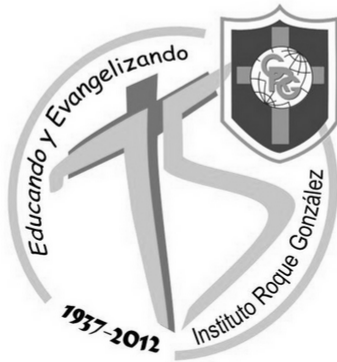
Logo oficial del 75 Aniversario del Roque Colegio